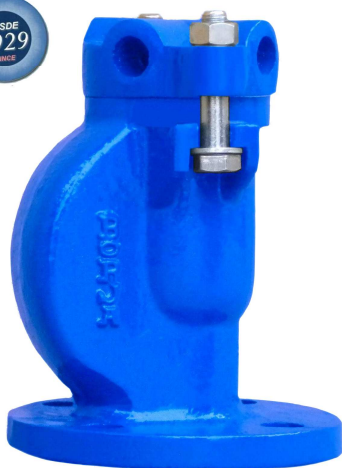
FIG.26 Con brida With flange