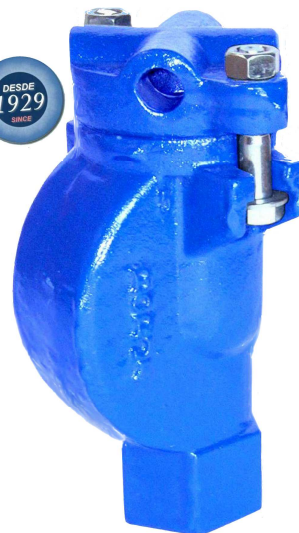
FIG.26 Extremo roscado Threaded end