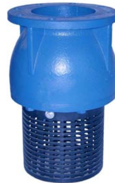
FIG.54 Con brida especial With especial flange