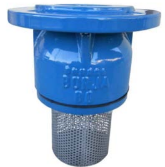
Con avispero en acero Inoxidable AISI 304 With stainless steel AISI 304 strainer construction