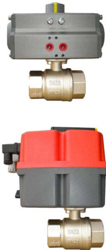
FIG.63 DOS VÍAS TWO WAYS