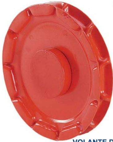
VOLANTE DE CADENA RACK WHEELS