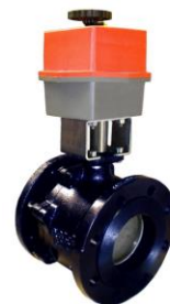
Con actuador eléctrico monofásico With monophasic electric actuator