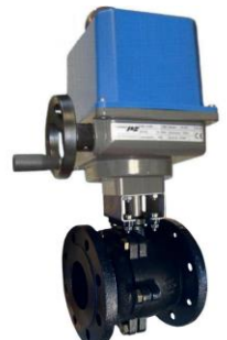
Con actuador eléctrico trifásico With three phase electric actuator