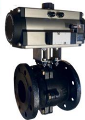
Con actuador neumático simple efecto With spring return pneumatic actuator