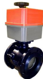
Con actuador eléctrico monofásico With monophasic electric actuator