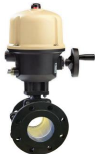
Con actuador eléctrico trifásico With three phase electric actuator