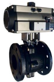
Con actuador neumático doble efecto With double acting pneumatic actuator