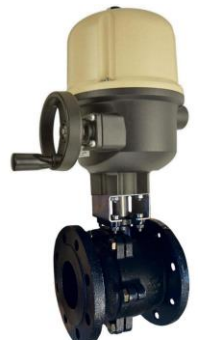
Con actuador eléctrico trifásico With three phase electric actuator