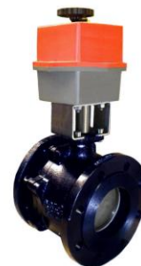
Con actuador eléctrico monofásico With monophasic electric actuator