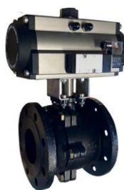
Con actuador neumático simple efecto With spring return pneumatic actuator