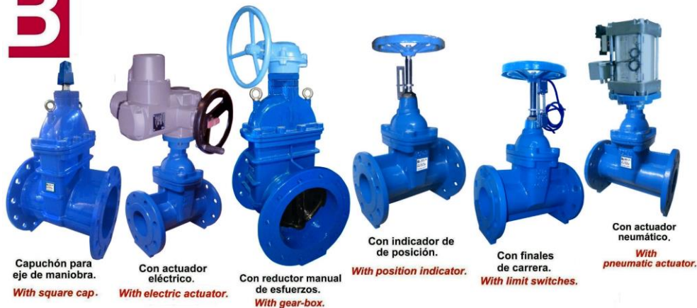
Capuchón para eje de maniobra. With square cap.