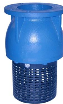
FIG.54 Con brida especial With especial flange