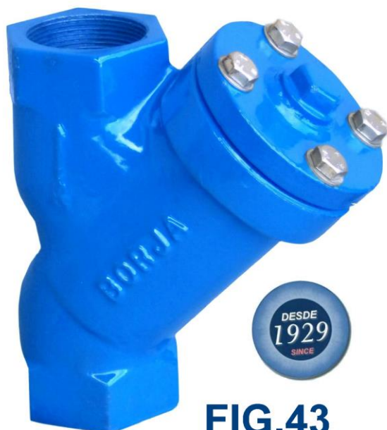
FIG.43 R 1/2" - R2" Ø15 - Ø50