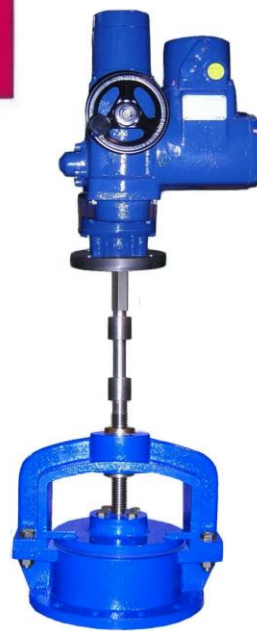
Con eje prolongado y actuador eléctrico trifásico With spindle extension and three phase electric actuator