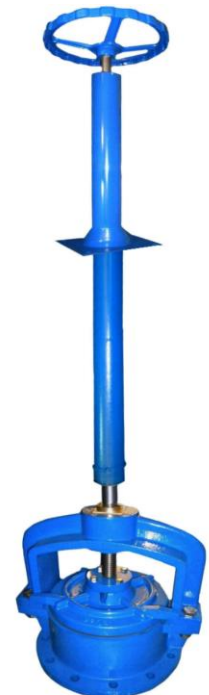
Con eje prolongado y columna de maniobra con volante With spindle extension and handwheel