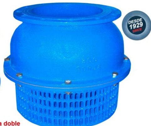
FIG. 14 Ø300-Ø600