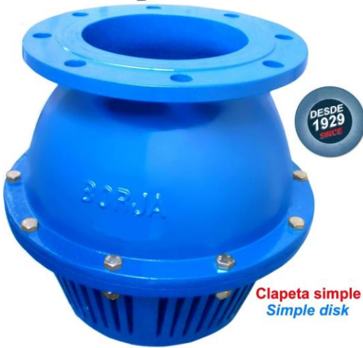
Clapeta simple Simple disk