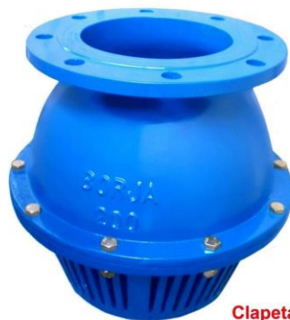
Clapeta doble Double disk