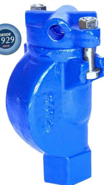
FIG.26 G1"- G1 1/2"