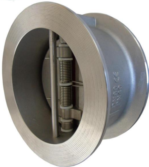
FIG.37 Ø40-Ø300 AC. INOX. STAINLESS STEEL