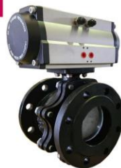
Con actuador neumático simple efecto With spring return pneumatic actuator