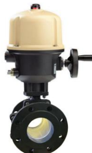
Con actuador eléctrico trifásico With three phase electric actuator