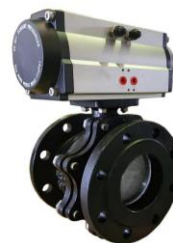
Con actuador neumático doble efecto With double acting pneumatic actuator